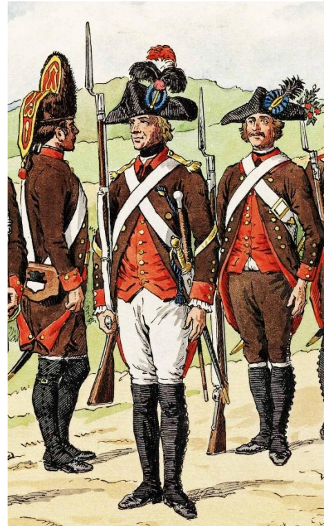
Lithografie Fussvolk 1792

Füsiliere, Unteroffiziere und Offiziere trugen einen Dreispitz mit der blau-schwarzen Kantonskokarde.