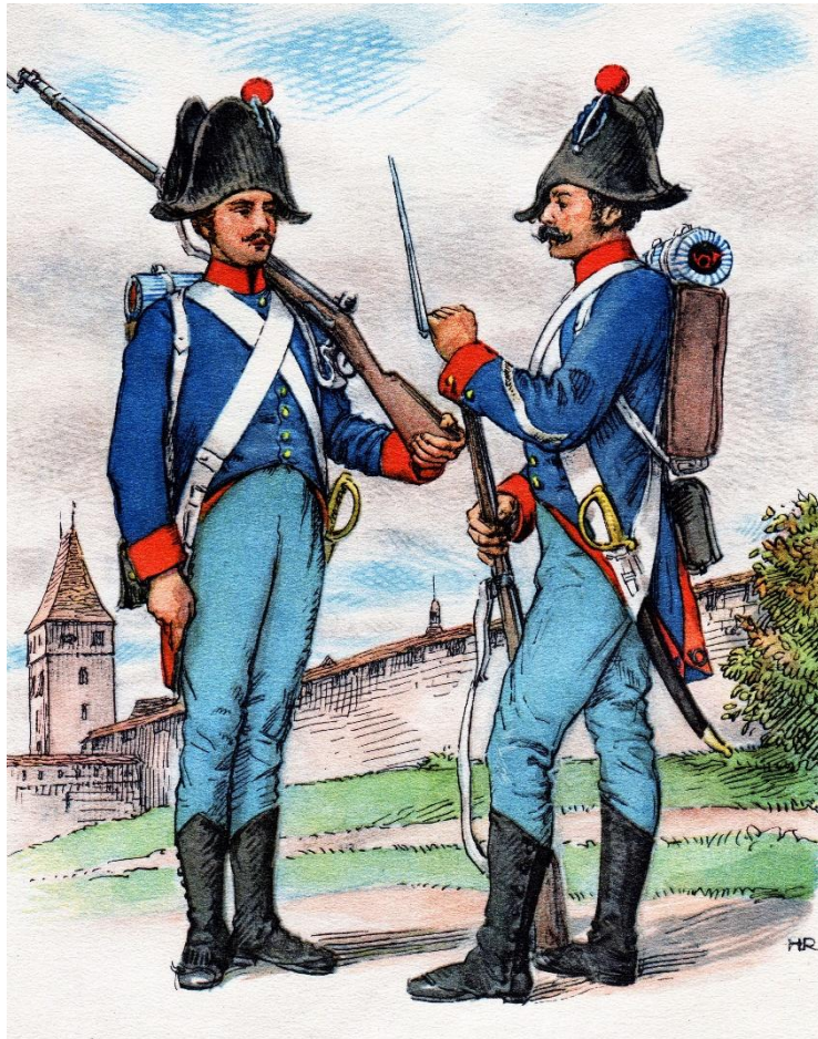
Lithografie von 1819

Als weitere Uniform tragen Mitglieder des Vereins historischer Uniformen die blaue Uniform, früher genannt «Genfer». Die «Genfer» waren eine Milizarmee Freiburgs, heute genannt «Freiburger Grenadiere». Die alte Uniformbezeichnung «Genfer» zeigte jahrelang eine falsche Herkunftsrichtung. 1803 organisierte die Eidgenossenschaft ihren militärischen Schutz neu mit kantonalen Milizen. Dazu schuf 1804 der Kanton Freiburg das «Corps Franc» mit der blauen Uniform.