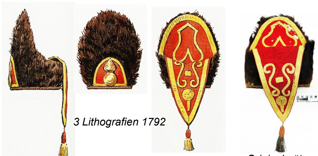
3 Lithografien 1792

Lithografien aus dem 19. Jahrhundert und einige Fotos aus dem frühen 20. Jahrhundert zeigen, dass dieser Truppe auch Grenadiere angehörten, die eine Bärenfellmütze mit einem roten Tuchschild und einer metallenen Granate auf der Stirnseite trugen. So beschloss der Verein historischer Uniformen 2023, diese markante, kremenlose, zipfelmützenartige Kopfbedeckung wieder herstellen zu lassen. Gründliche Nachforschungen und die Suche nach einer Originalmütze (ein Exemplar befindet sich im Historischen Museum Bern) waren notwendig, um diese Mützen originalgetreu nachbilden zu können. Dank persönlichen Beziehungen konnte der Verein aus einem Privat zoo ein Bärenfell beziehen.