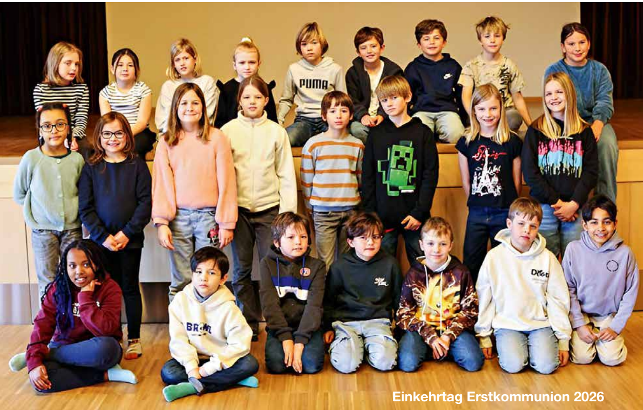
Einkehrtag Erstkommunion 2026

Seelsorgeeinheit Düdingen – Bösinggen/Laupen