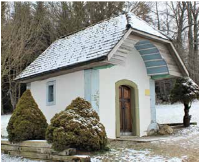
Kapelle Seelholz Galtern

Eröffnet wird die Ausstellung am Samstag, 21. Mai nach dem Vorabendgottesdienst mit der Vernissage und anschliessendem Aperitif (ca. 18.00 Uhr). Lassen Sie sich diese besondere und inspirierende Ausstellung nicht entgehen!