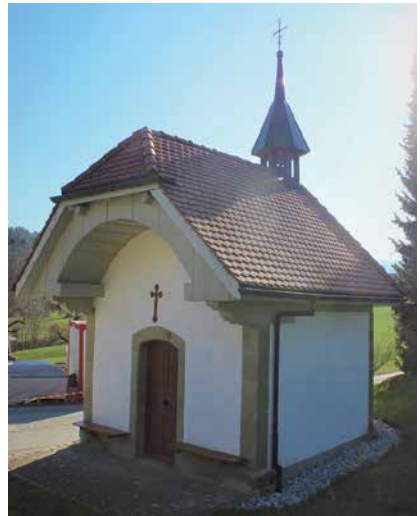
Kapelle Neuhaus Plasselb