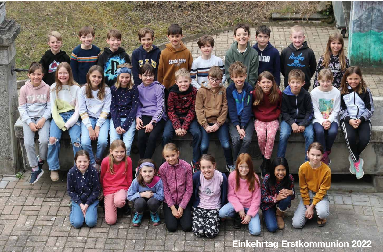
Einkehrtag Erstkommunion 2022

Seelsorgeeinheit Düdingen – Bösing/Laupen