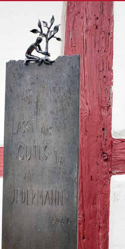
Lasst uns Gutes tun an Jedermann, Skulptur von Thomas Hürmer

möglich z. B. in einer Patientenverfügung festzulegen, welche medizinischen Massnahmen ergriffen und welche vermieden werden sollen.