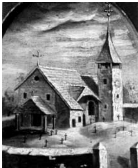
Die alte Pfarrkirche 1833

Das Buch «Geschichte und Geschichten der Pfarrei Düdingen» kann zum Sonderpreis von Fr.10.– im Pfarramtsekretariat bezogen werden. Dieses interessante und eindrücklich illustrierte Buch eignet sich auch gut als Geschenk.