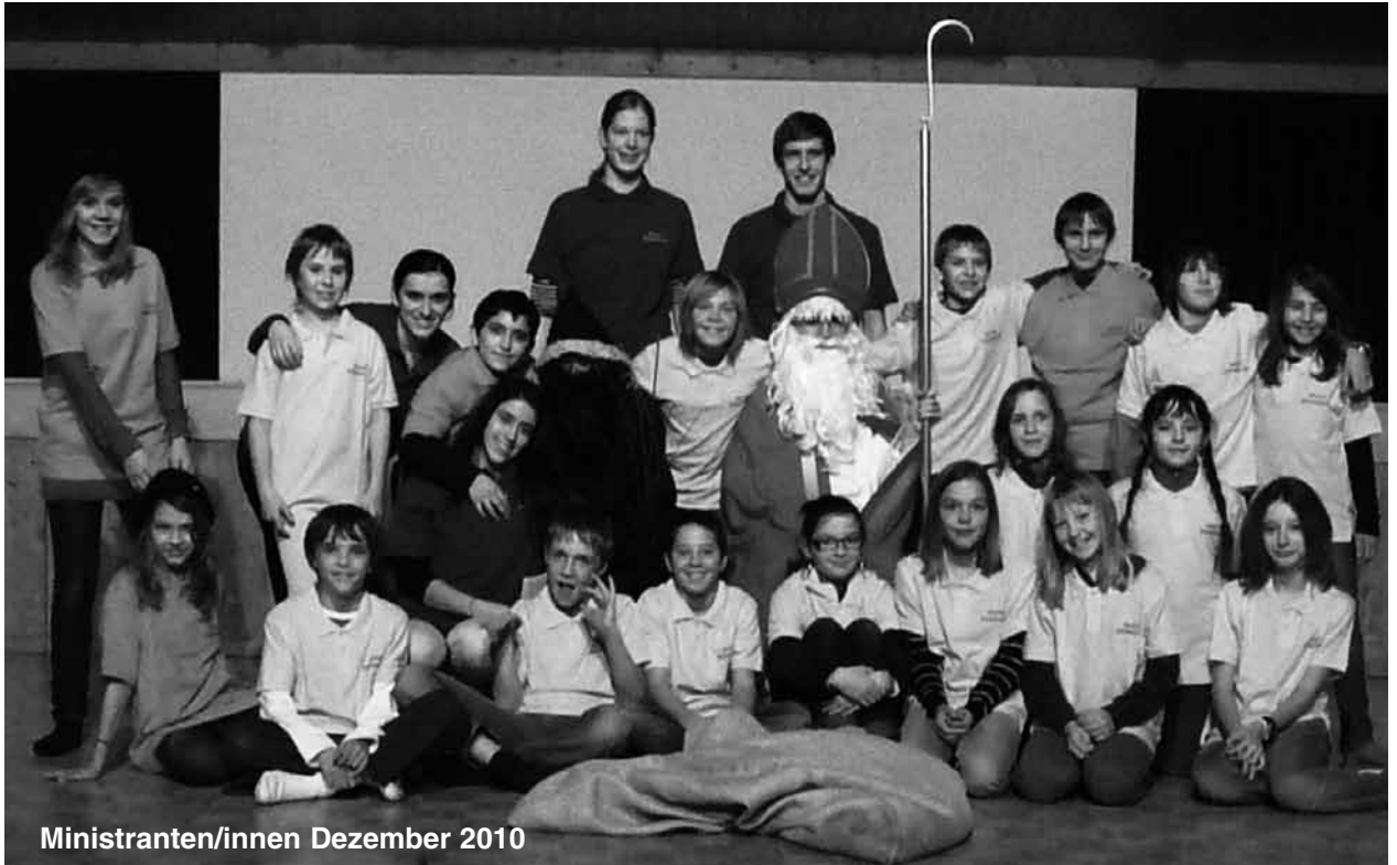
Ministranten/innen Dezember 2010

Seelsorgeeinheit Düdingen – Bösinggen/Laupen