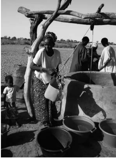
Weltmission 2010 Afrika (Togo)