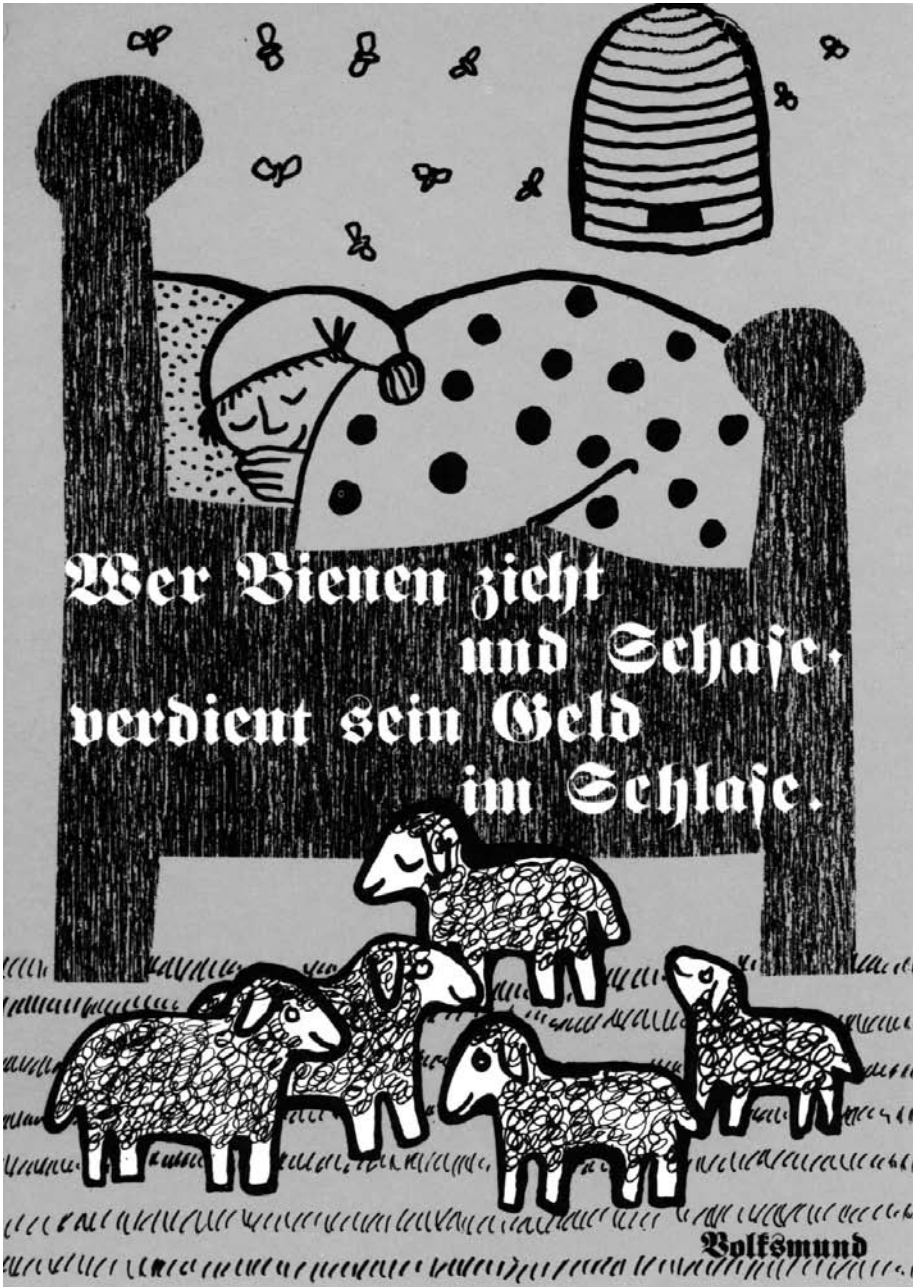
Maria Laach No 2383