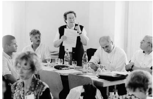
Engagierte Sitzung während AD2000

Zwei Gegebenheiten haben sich verändert, hält der Diözesanbischof fest. Einerseits die Schweizer Gesellschaft selber mit neuen Armutstypen (die Armut der reichen Gesellschaften) und andererseits unsere Fähigkeit, im Dienste unserer Schwestern und Brüder zu stehen. «Welches sind die neuen Probleme, welche die Humanität unserer sozialen Gesellschaften zerstören? Und was können wir dagegen tun?»